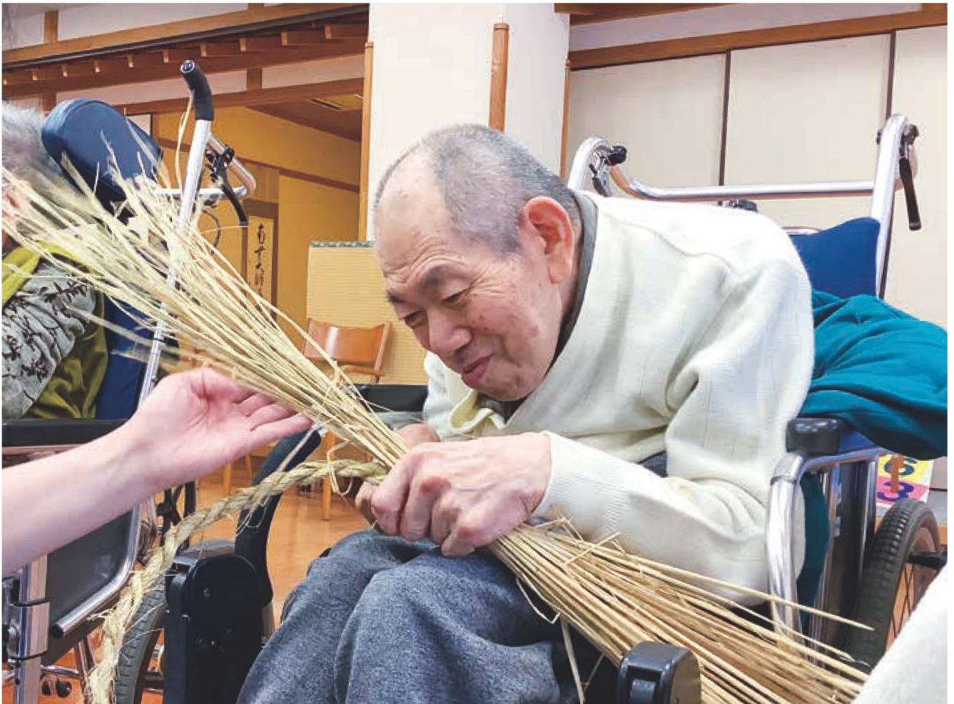
(於:むらおかこぶし園)

https://www.facebook.com/mikatakobushinosato/